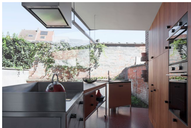
Ontwerp: MARCEL architecten