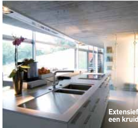
Extensief groendak aangelegd boven de keuken : een kruidentuin binnen handbereik...

Een groendak zorgt ervoor dat aanzienlijk minder regenwater in het rioleringsstelsel wordt geloosd (het verdampt). Bovendien buffert het de piekdebieten veroorzaakt door stortbuien (sponseffect).