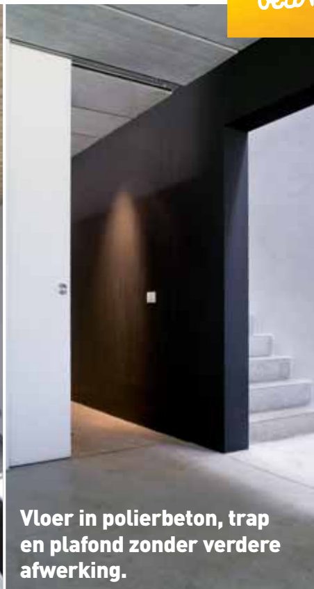
Vloer in polierbeton, trap en plafond zonder verdere afwerking.