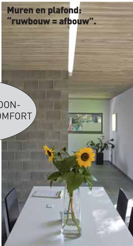
Muren en plafond: "ruwbouw = afbouw".

Beton is een natuurlijk materiaal, gezond en bestand tegen verrotting. Het is de duurzame en energie-vriendelijke OPLOSSING voor uw woning.