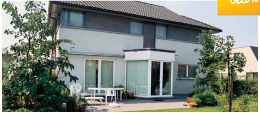
arch. J. Grauwels