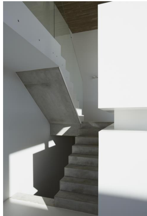
© Arch. Max8 – foto A. Nullens