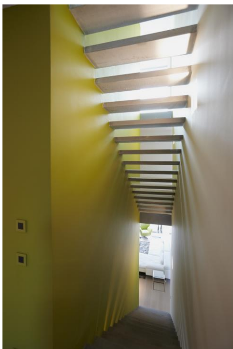
© Arch. Crepain-Binst – foto A. Nullens