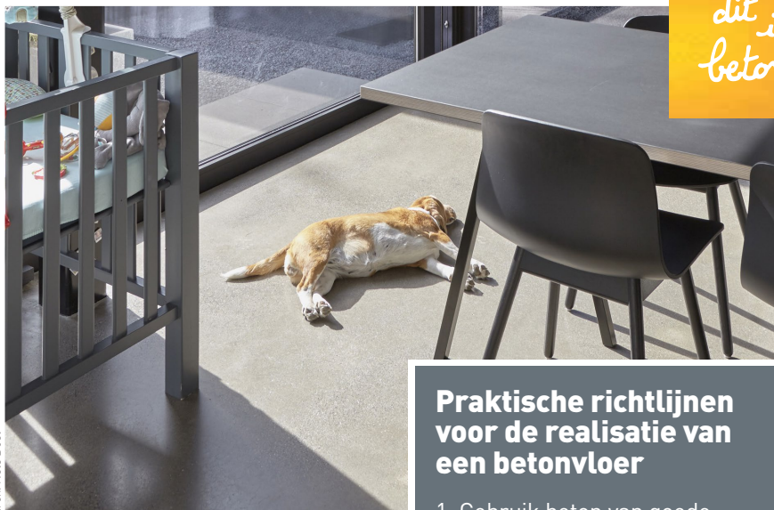
arch. Nèle Boel