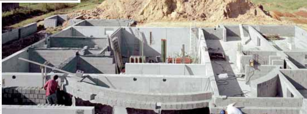
Arch. : Walter Wuyts