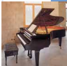
Arch. : Paul Driessens

Grâce au béton, une qualité acoustique "salle de concert" et sans gêner les voisins.